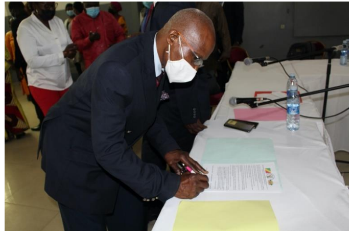
Signature de l'engagement par le représentant de l'Alliance du secteur privé de la santé au Congo