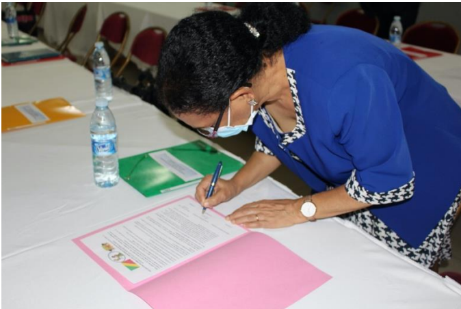
Signature de l'engagement par la Présidente de la SOCOPEP

Face aux faibles connaissances sur la vaccination, à l'insuffisance de sensibilisation des populations et à la faible confiance aux vaccins et aux acteurs, les sociétés savantes en présence des membres du Comité des Opérations d'Urgence Polio (COUP) se sont engagées solennellement à travers une déclaration officielle signée des présidents de ces organisations. Plus que par le passé, le soutien au programme contre la poliomyélite est en marche en République du Congo à travers le leadership des sociétés savantes.