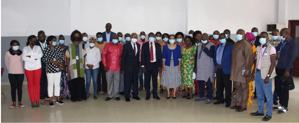
Photo de famille à l'issue de la rencontre

Pour faire face aux défis de l'heure liés à l'acceptation de la vaccination, il est plus que jamais indispensable de faire recours à des approches innovantes pour soutenir les efforts fournis pour l'éradication de la poliomyélite dans le monde.